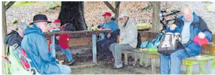
Schutz vor dem Wetter bei der Pause beim Waldgrillplatz.