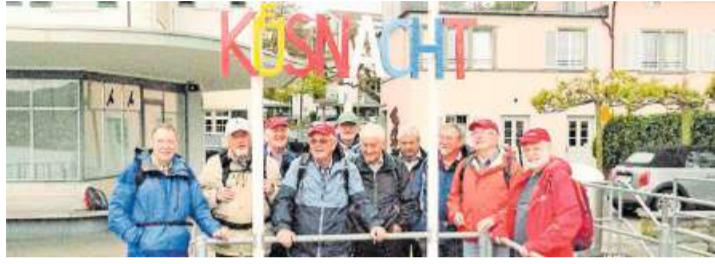
Ankunft der Dietiker Wandersleut in Küsnacht.