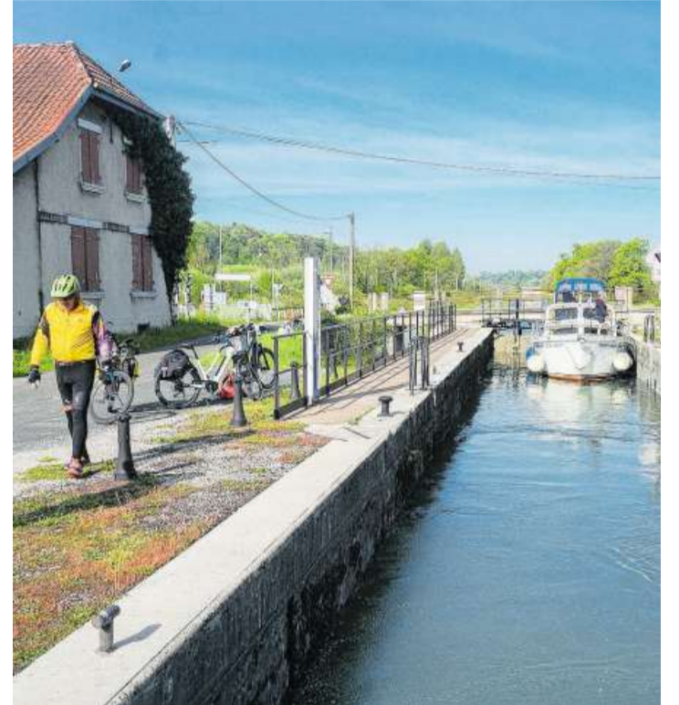
Unterwegs bei wunderbarem Wetter.